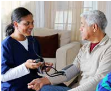
SOINS À DOMICILE

Une infirmière rend visite à un patient qui vient tout juste de sortir de l'hôpital et passe sa convalescence à domicile. À l'arrivée, elle se connecte en toute sécurité au réseau de l'hôpital après s'être authentifiée avec le lecteur d'empreinte digitale et sa carte à puce. L'infirmière ausculte son patient, pression artérielle, rythme cardiaque, capacité pulmonaire, température, poids, niveau d'oxygène dans le sang... Grâce à la connexion sans fil 4G LTE de la C5m, les données sont téléchargées rapidement et partagées en temps réel avec le cardiologue, qui confirme son diagnostic et la prescription médicamenteuse. Avant de partir, l'infirmière fixe un nouveau rendez-vous pour la semaine suivante et fait signer au patient un formulaire numérique de confirmation.