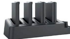
Chargeur de batteries