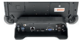
Station de bureau