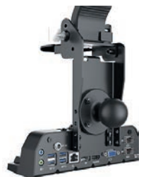
Station d'accueil mobile