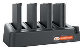
Chargeur de batterie