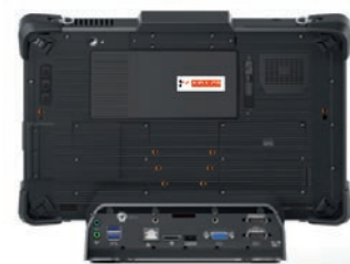
Station de bureau