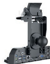
Station d'accueil mobile